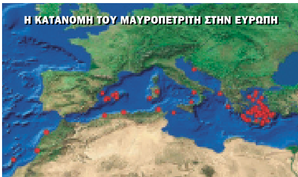
Η ΚΑΤΑΝΟΜΗ ΤΟΥ ΜΑΥΡΟΠΕΤΡΙΤΗ ΣΤΗΝ ΕΥΡΩΠΗ

Περισσότερες πληροφορίες: www.ornithologiki.gr